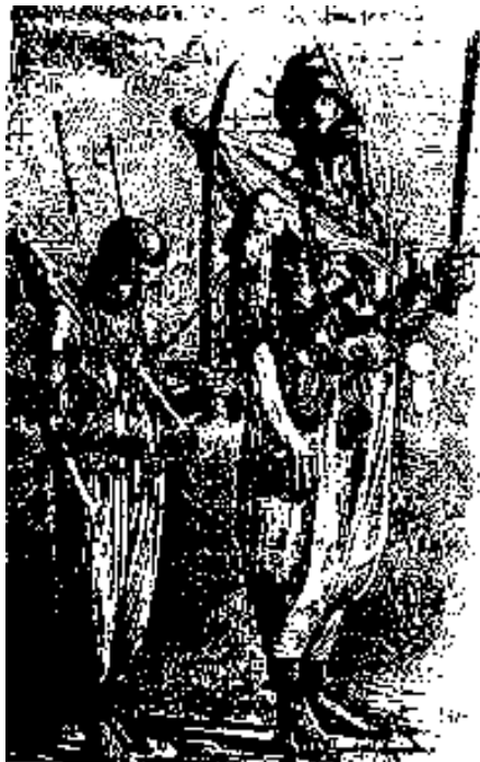
دو تن قفل به تن

روز دهم یا عاشورا «دیوانگی!» بالا رفتی. از آغاز روز صد دسته شاه حسینی راه افتادی. از هر کوی و کوچه قمه زنان با سرهای شکافته و کفهای سفید خون آلود بیرون آمدندی. مردم قره باغ در تبریز و تهران «قفل به تنان» آوردندی.