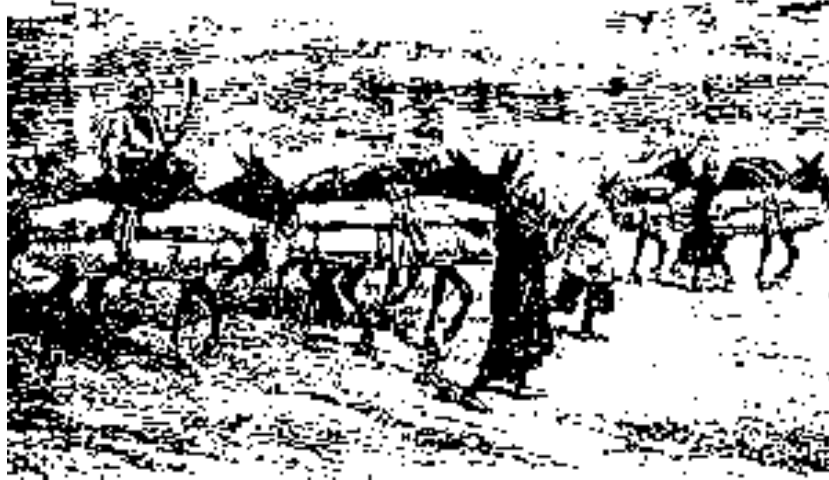
استخوانهای مردگان را بار کرده به کربلا میبرند

عثمانیان گاهی به جلوگیری پرداختندی بارها رخ داده که استخوانها را خرد کرده و در توبره اسب ریخته خواسته اند نهانی از مرز گذرانند و دانسته شده و مایه رسوایی گردیده. ۱