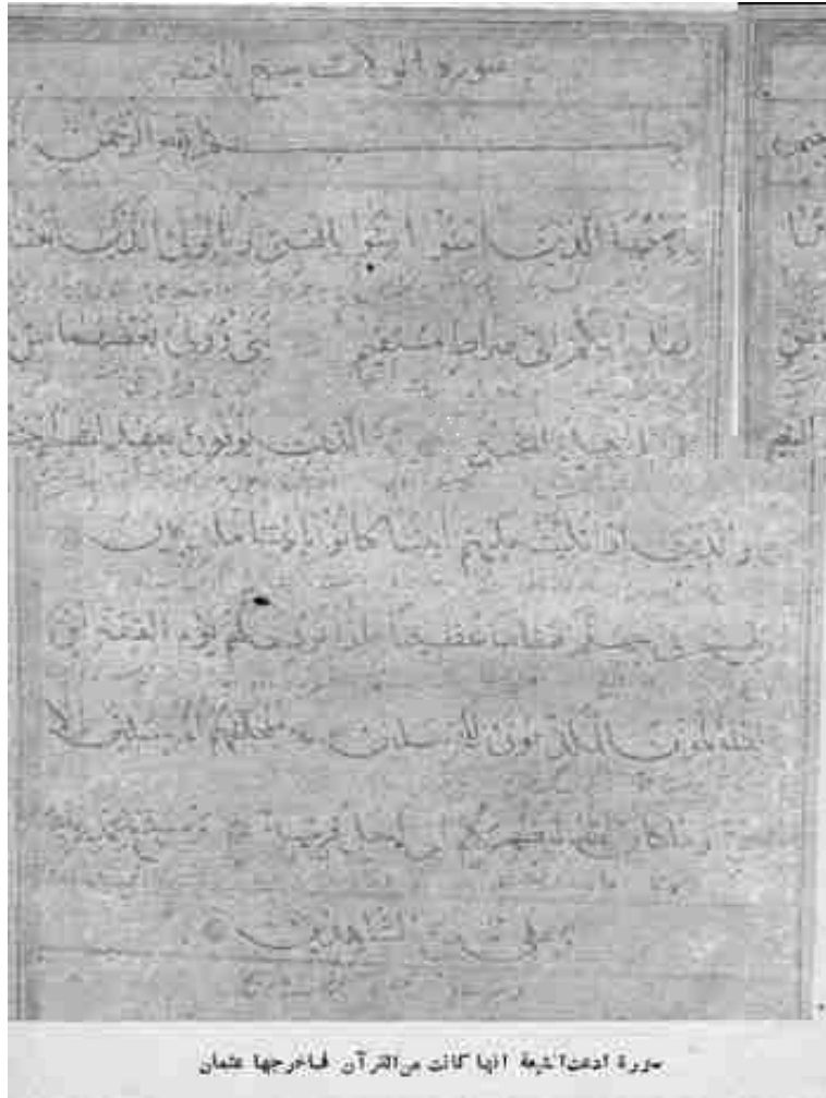
یکی از دو سوره که به قرآن افزوده اند

سیزدهم: در داستان امام ناپیدا سخن فراوانی هست و ایرادهای بسیاری توان گرفت: