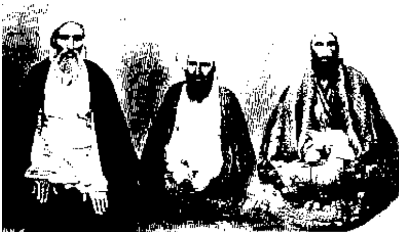
از راست بچپ: حاجی شیخ مازندرانی - حاجی تهرانی - آخوند خراسانی

با آنکه پیشوای این جنبش دو سید میبودند و سه تن از علمای بزرگ نجف که آخوند خراسانی و حاجی میرزا حسین تهرانی و حاجی شیخ مازندرانی باشند، مردانه پشتیبانها می نمودند، در میانه با ملایان نبرد سختی پدید آمد.