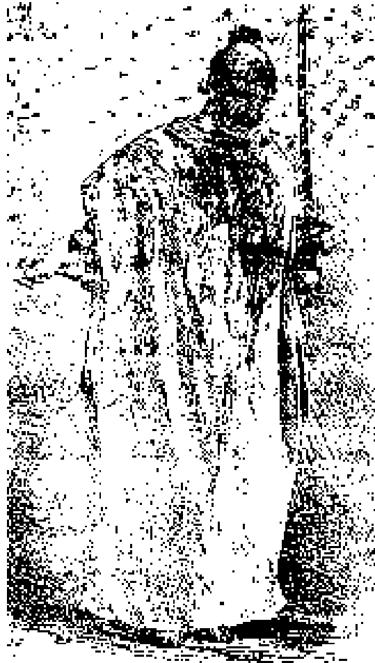
یکتن از قمه زنان

جنگها نومید شده و آتش سینه هاشان رو به خاموشی نهاده بود، و از آنسوی دولت خودکامه روس سپاه به ایران آورده و آذربایجان و دیگر شهرها را گرفته به کاستن از نیروی آزادیخواهان میکوشید، ناگهان این دفترچه به میان افتاد. ۱ تو گفتی نفت به روی آتش ریختند. ملایان و روضه خوانان و بسیاری از مردم به تکان آمده، و با آزادیخواهان که به کاستن از روضه خوانی میکوشیدند پرخاش آغازیده چنین گفتند: «پس فرنگیها امام حسین را میشناسند و شما نمیشناسید، ای بیدینها؟!». این را گفته به تکان آمدند.