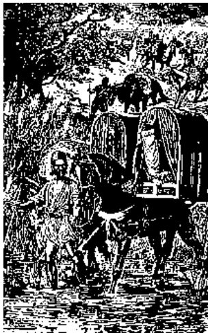
زن ایرانی به زیارت کربلا میرود

هفتم: آن بارگاهها که در مشهد و قم و عبدالعظیم و بغداد و سامره و کربلا و نجف و دیگر شهرهاست و شیعیان به زیارت روند خود جداگانه داستانیست.