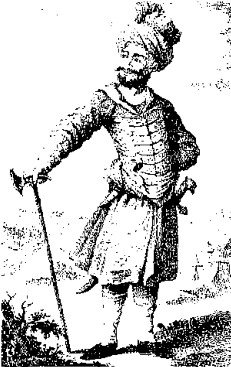
پیکره نادر قلی (تهماسب قلی خان) که در زمان خودش کشیده شده

نشاندند به گفتگو و داشت و بارها به عثمانیان فرستادگان فرستاده با این شرط پیشنهاد آشتی کرد و در دشت مغان چون پادشاهی را می پذیرفت از ایرانیان در این باره پیمان گرفت. ولی این کوششها همه بیهوده درآمد و آن پادشاه غیرتمند کشته گردیده از میان رفت. شیعیگری به حال خود مانده تا به اینجا رسید که امروز است. داستان آنرا با مشروطه نیز همگی میدانیم. اینست فهرستی از تاریخچه رواج شیعیگری در کشور ایران.